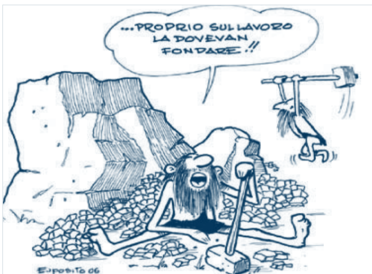
A sinistra la vignetta che illustra l'art. 1 della Costituzione.

* Assegnista di ricerca di Diritto costituzionale dell'Università di Pisa; Laboratorio Wiss - Scuola Superiore Sant'Anna di Pisa.