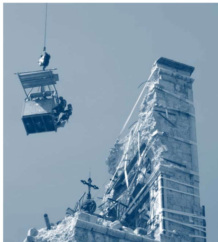
● Messa in sicurezza del campanile di San Bernardino a L'Aquila