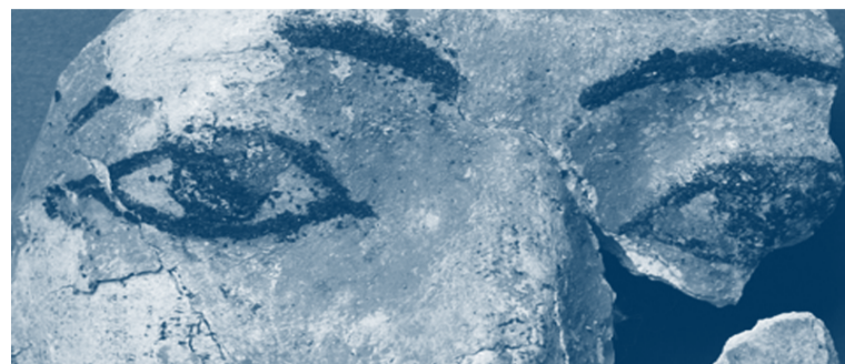
● Dettaglio da una maschera funeraria femminile rinvenuta nella tomba di Huy

► B.: Una disseminazione rapida delle informazioni di scavo è un requisito assai importante della ricerca archeologica: l’incremento della documentazione e il confronto tra i dati e le metodologie sono gli strumenti di base su cui si costruisce il processo interpretativo. A questo fine, la messa a disposizione della comunità scientifica dei risultati di scavo sul web e i rapporti tempestivamente pubblicati per ogni campagna sono ormai un dovere fortemente sentito da molte missioni archeologiche, compresa la nostra. Tuttavia, né la comunicazione quasi immediata