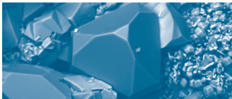
● Fig. 1 - Aphanite (foto al microscopio elettronico a scansione).

► P.: L'impostazione è quella del CD-ROM: il libro è organizzato in schede di una pagina, una per minerale, disposte in rigoroso ordine alfabetico, anche se in una serie di indici e